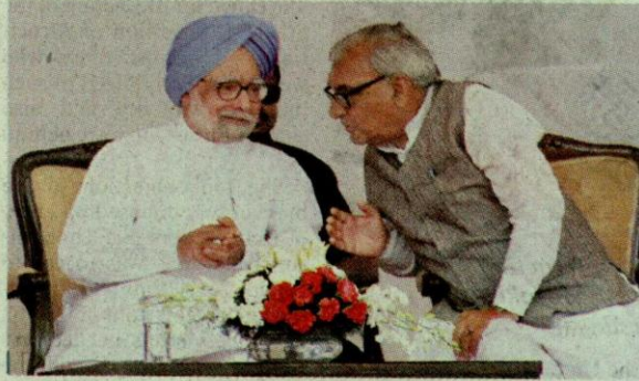
Prime Minister Manmohan Singh in conversation with Haryana Chief Minister Bhupinder Singh Hooda during a function at Binola village in Gurgaon on Thursday.

Saying it was imperative that our defence professionals remain abreast of the complex environment we face, Dr. Singh said: "We are living at a moment of history when the world is witnessing change on a scale and at a speed rarely seen before. Nowhere is this change more